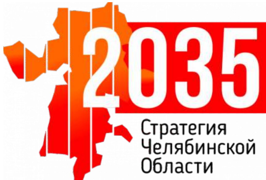
Схема территориального планирования (2018)

Стратегия Челябинской области 2035 (2018) (включение агломерации «Горный Урал» и агломерационных проектов в стратегию)