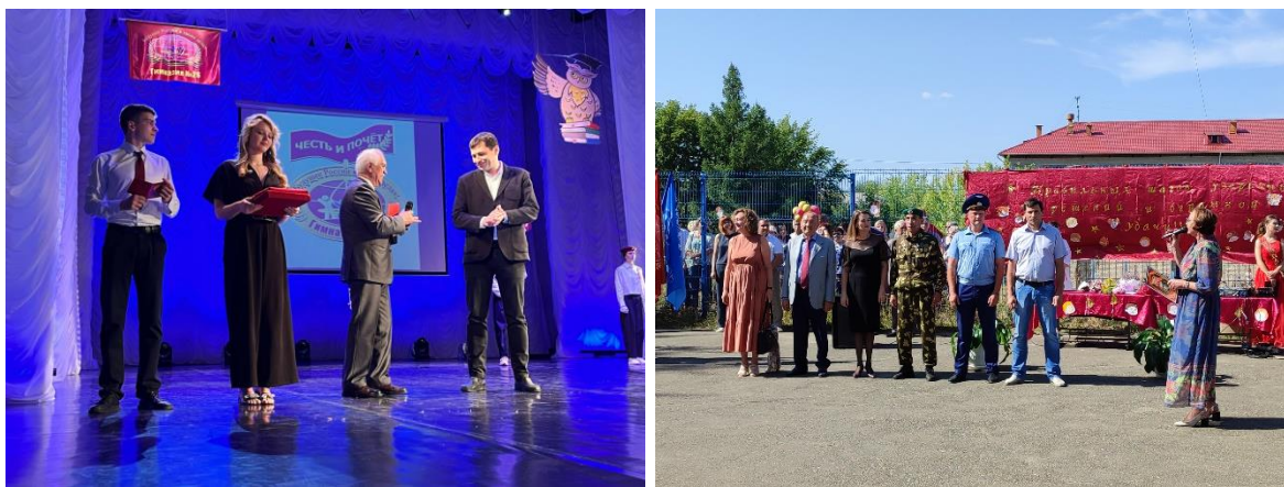
Участие в школьных мероприятиях

Работа с обращениями граждан – не менее важное звено в работе депутата. За отчетный период в мой адрес поступило более 30 обращений, не считая обращений по телефону и вопросов, поступивших в социальных сетях. Все обращения рассмотрены, заявители получили разъяснения и ответы.