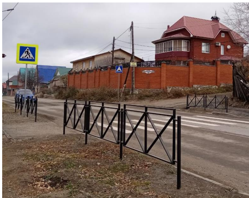
Пешеходный переход по ул. Уральской

Постоянно принимаю участия в различных мероприятиях – поздравлениях ветеранов ВОВ, школьных награждениях и линейках, организациях новогодних мероприятий для ребят округа.