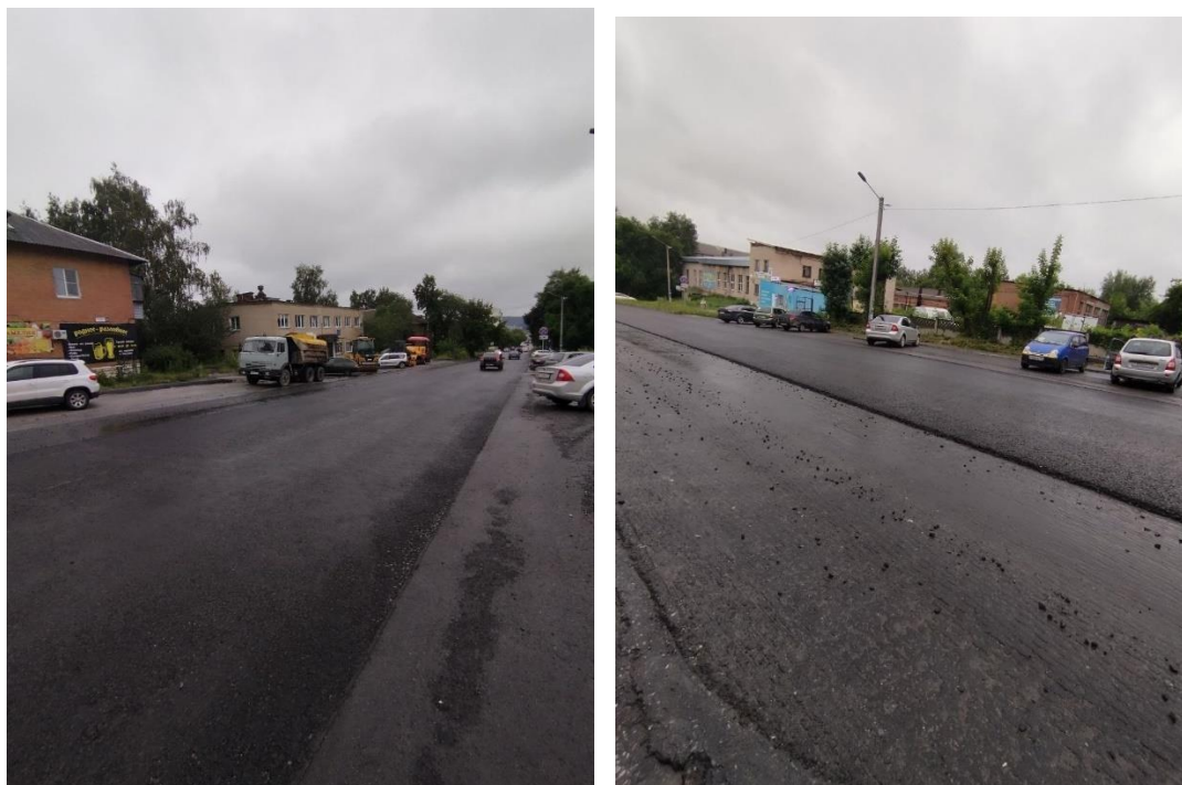
Выполнение работ по укладке дорожного покрытия ул. Лихачёва

В рамках проекта «Дорожный рынок 2024» были выполнены работы по укладке дорожного покрытия ул. Лихачёва (от ул. Уральской до перекрёстка с пр. Автозаводцев и ул. 8 Марта и от перекрёстка до пересечения с улицами 8 Июля и Академика Павлова). На этом маршруте было проведено и оборудование пешеходных переходов в соответствии с требованиями законодательства: нанесена разметка и заменены ограждения.