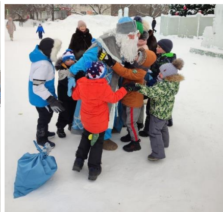
Новогодние забавы для детей