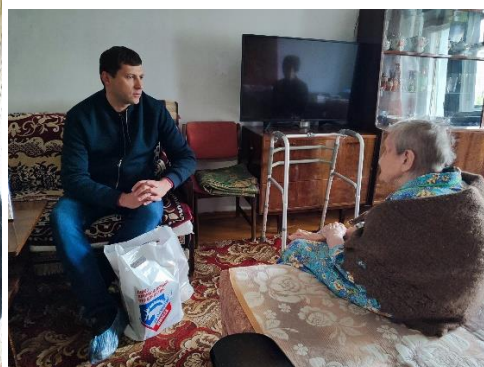
Поздравление участников Великой Отечественной войны и тружеников тыла с Днем Победы