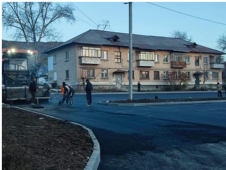
Проведение работ по улице Уральской, № 106, 108, 112, 114

Подобное обновление произошло и возле домов №79, 81 по улице Уральской. Установлены бордюры, оборудованы пешеходные дорожки и парковки для автомобилей, полностью заасфальтирован междворовой проезд. По завершению работ пространство стало более комфортным и безопасным для жильцов.