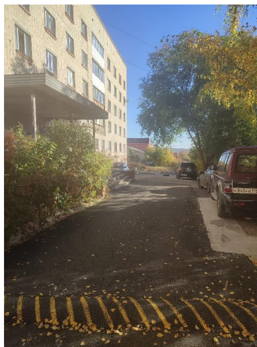
Благоустройство двора ул. Уральская, №79,81